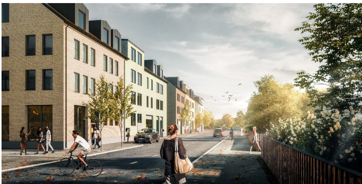
Perspektiv längs Stockholmsvägen, kvarteret Strömmingen 1-7 m. fl. Archus Arkitektur, byggaktör Riksbyggen

Gäller från och med 1 januari 2021 Fastställd av kommunfullmäktige 23 november 2020