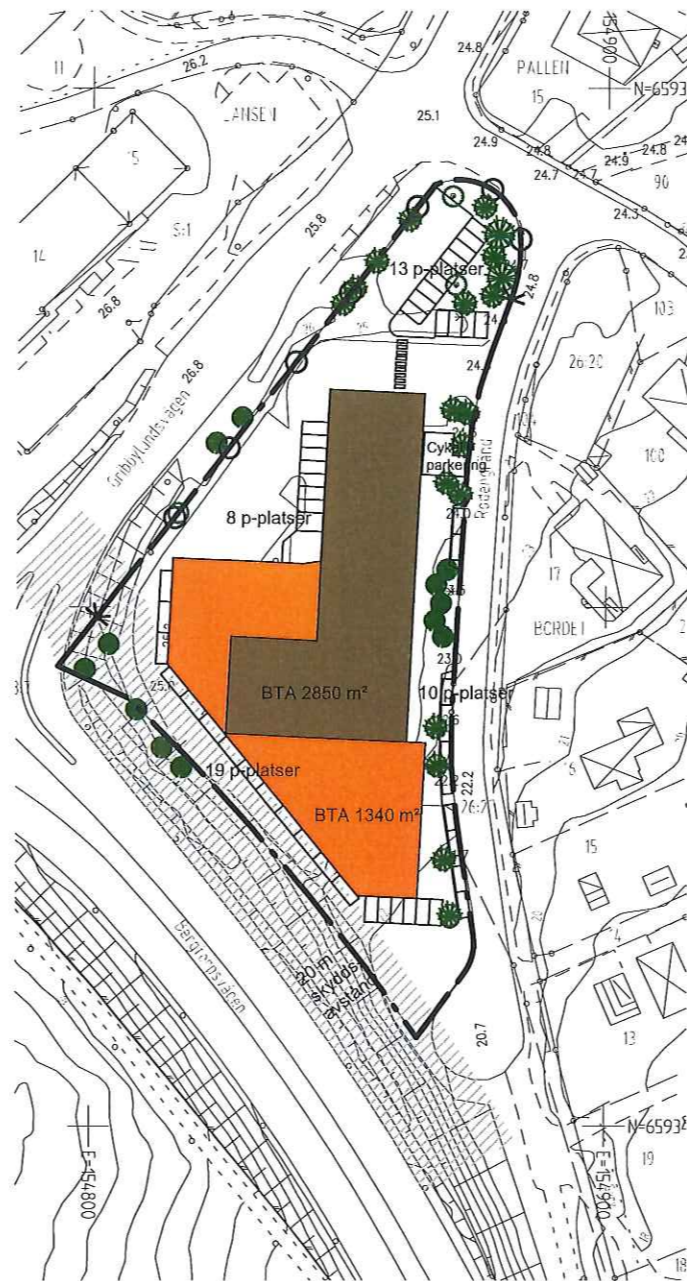
ILLUSTRATION (EJ BINDANDE)