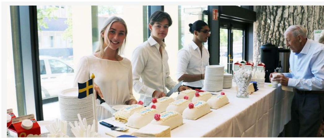
Fika med tårta fanns att få i dialogcaféet.