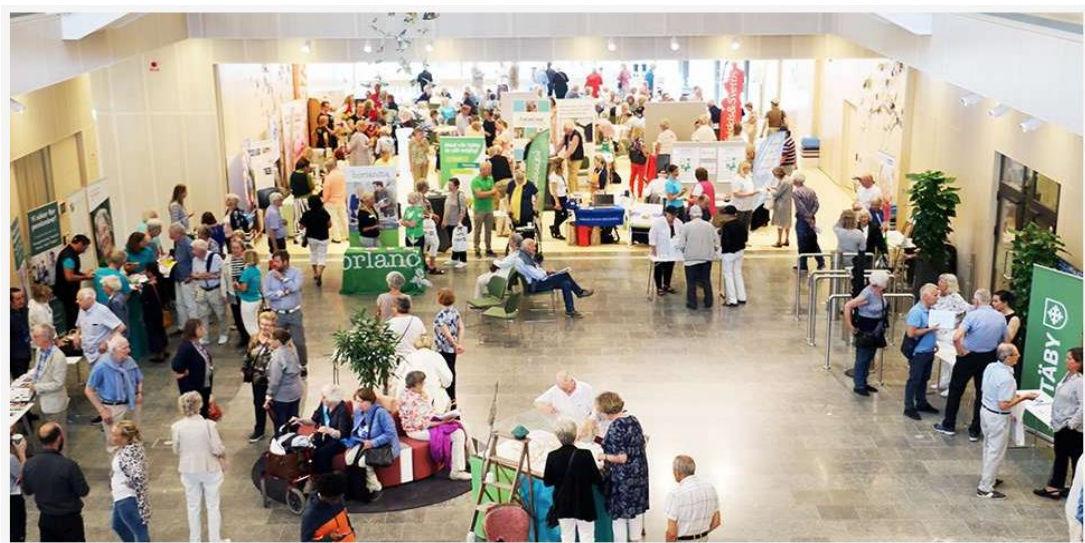
Bild från Seniordagens mässdel.

Av besökarna fyllde 106 personer i en utvärdering, se bilaga 2. Av dem som besvarade enkäten uppgav 95 procent att de upplevde Seniordagen som bra eller mycket bra. Det fanns även möjlighet att i fritext lämna kommentarer, vilket flera gjorde, se bilaga 2. Som tack för utvärderingen fick den svarande en give-away i form av ett minitouchverktyg med Täbyloggan som används till mobiltelefoner.