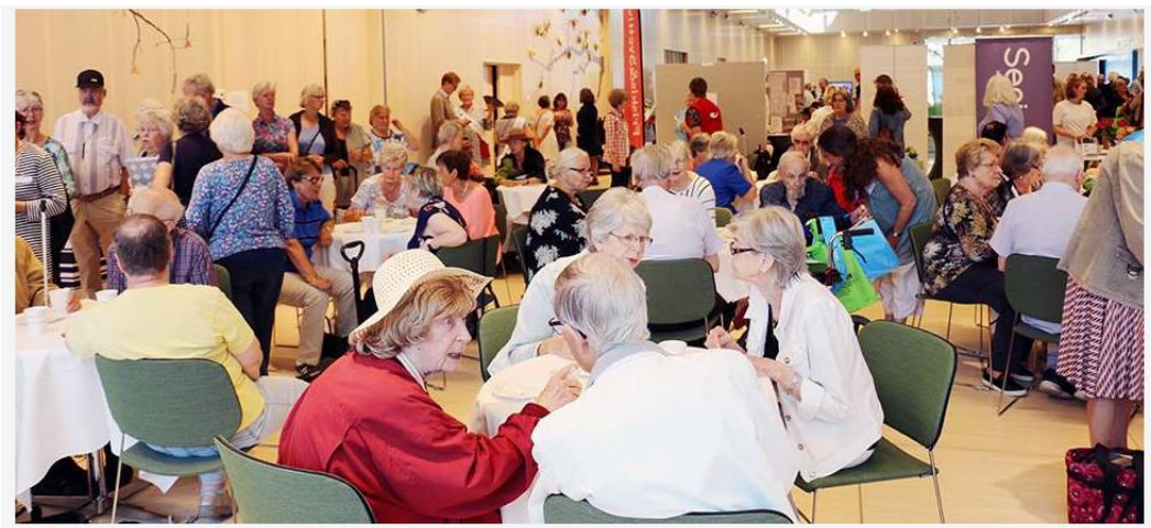
Bild från caféet.