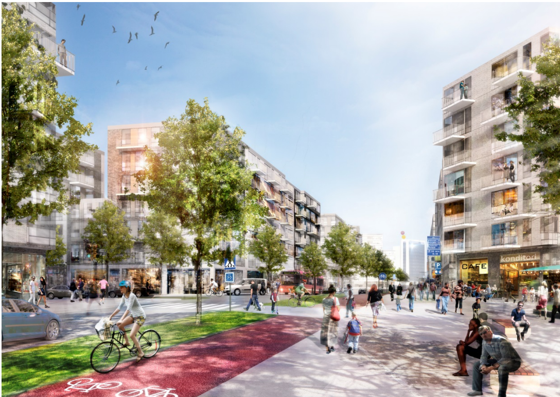
Boulevarden i Täby park med Täby centrum i fonden